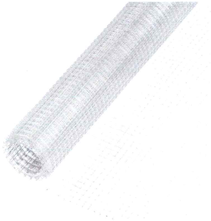
Тоног төхөөрөмжийн даавуу